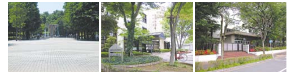
赤塚公園 徒歩5分(約400M) 高島第三小学校 徒歩3分(約200M) 高島平図書館 徒歩15分(約1,200M)