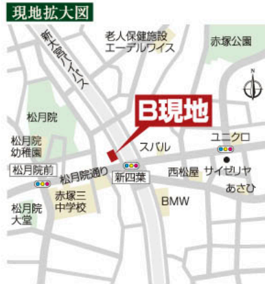
「赤塚八丁目」新築住宅物件概要

□所在地/板橋区赤塚8丁目1番18号□交通/都営三田線「新高島平」駅徒歩15分□敷地面積/60.67㎡、他私道持分141㎡×1/13有□建物面積/91.28㎡(車庫10.97㎡含)□建物構造/木造スレート葺3階建□建築年月/平成21年11月□用途地域/第一種中高層住居専用地域・第一種住居地域□建ぺい率/60%□容積率/200%□道路/南約4.5m道路□施設/東京電力、都市ガス、公営水道、本下水□公法制限/第二種高度地区、準防火地域□現況/完成済□引渡/即可 □取引形態/媒介