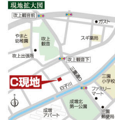
「成増五丁目」新築分譲住宅物件概要

□所在地/板橋区成増5丁目23番の内□交通/都営三田線「西高島平」駅徒歩16分□総棟数/2棟□今回販売/2棟□敷地面積/(1号棟)69.38㎡・(2号棟)69.27㎡□建物面積/(1・2号棟共)105.48㎡(車庫面積9.31㎡含む)□建物構造/木造サイディングスレート葺3階建□建築年月/平成22年3月上旬、建築確認番号第09UDI3T建01676号他□用途地域/第一種中高層住居専用地域□建ぺい率/60%□容積率/200%□道路/北約4m公道、東約3.6m私道(2号棟角地)□施設/東京電力、都市ガス、公営水道、本下水□公法制限/第二種高度地区、準防火地域□現況/建築中 □取扱形態/媒介